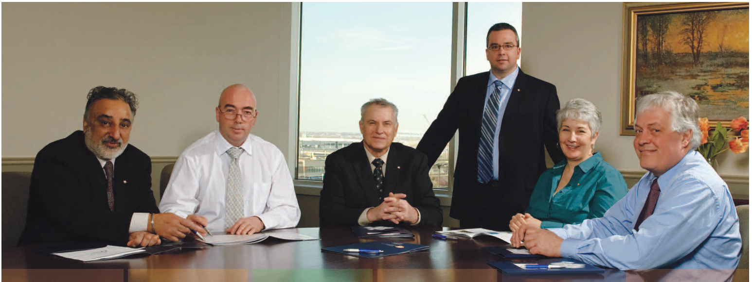
Manjinder Singh Sarkaria