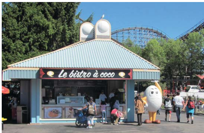
Le nouveau Bistro à coco de La Ronde est situé à la sortie du manège Le Splash.

Bien entendu, il faut du temps pour changer les habitudes de consommation. Mais n'est-ce pas là l'essence même du marketing ?